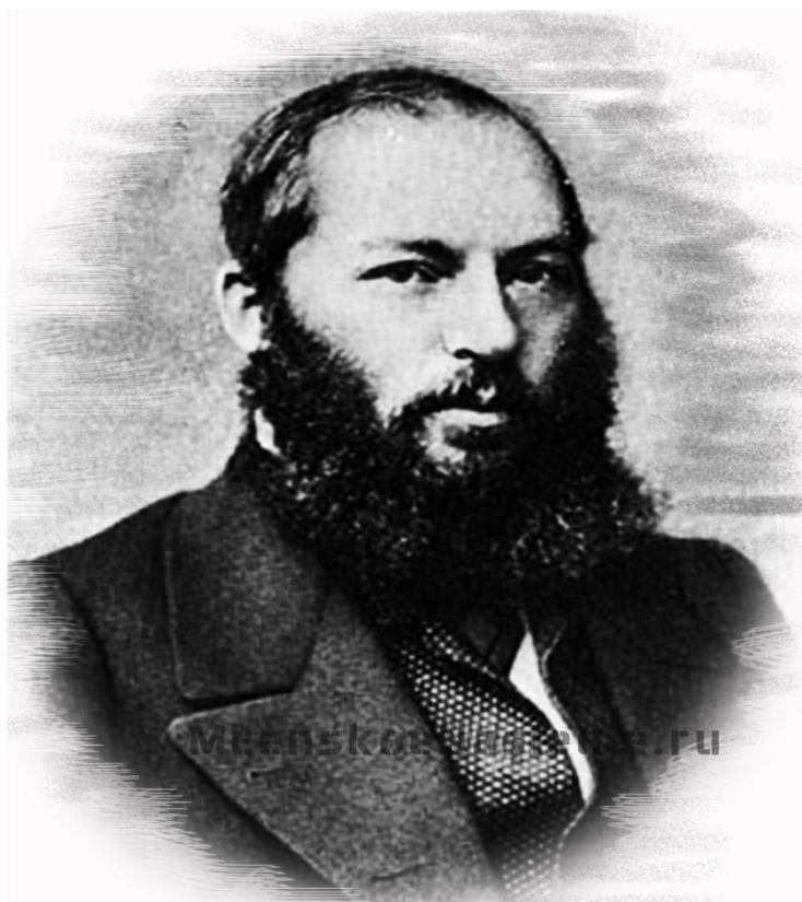
Афанасий Афанасьевич ФЕТ (1820 - 1892)

Стихи Афанасия Фета знакомы нам с детства. Преобладающее настроение в его произведениях — упоение природой, красотой, искусством. Таковы особенности лирики Афанасия Фета, его называют настоящим гением литературы, его творчество признано во всем мире. Лирические стихотворения этого автора затрагивают самые возвышенные, тонкие струны человеческой души. О природе в своих произведениях Фет умел говорить так, что перед читателем сразу возникала яркая, целостная картина. Литературные критики считают Фета утонченным лириком, отождествлявшим природу и человеческие чувства. Его называют большим художником, мастером лирических стихотворений. Свыше 180 его стихотворений положены на музыку.