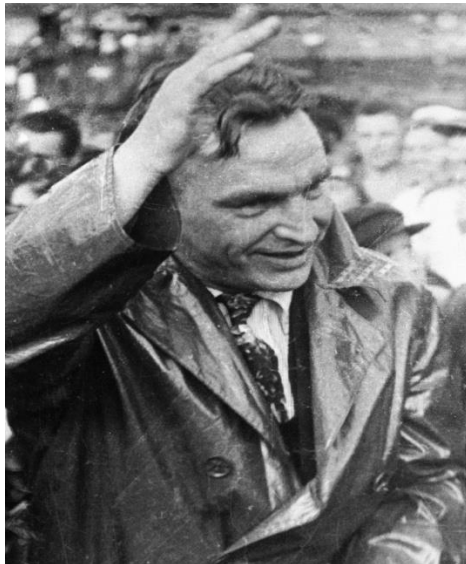
Валерий Павлович Чкалов.

Вот полярный летчик Ч. - "человек, в котором жил орел"; он басит, окает, говорит: "Если быть - так быть лучшим", погибает, его хоронят в Кремлевской стене. Если сегодня приходится все-таки догадываться, что это именно Чкалов, а не, допустим, Чухновский, искавший в Арктике пропавшую экспедицию Нобиле, то современный Каверину читатель всё улавливал мгновенно, и сокращение фамилии до инициала его не путало.