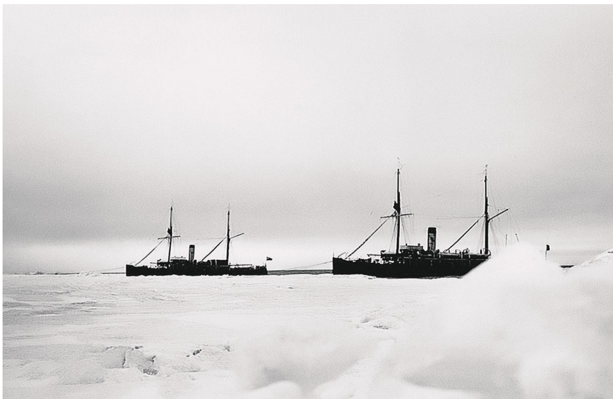
Арктическая экспедиция Бориса Вилькицкого. Суда "Таймыр" (слева) и "Вайгач" в полярных льдах.

Но если читатель его эпохи всё понимал без Википедии, то сегодня впору готовить новое издание "Двух капитанов" с обширным историческим комментарием.