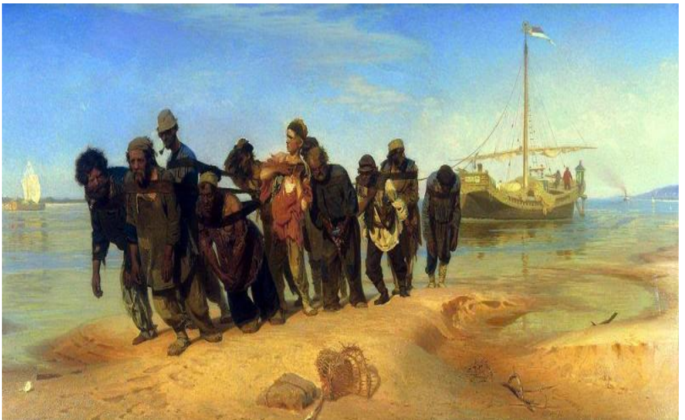
Илья Ефимович Репин – Бурлаки на Волге

Многие картины великих русских художников, представленные в Русском музее, знакомы нам с детства.