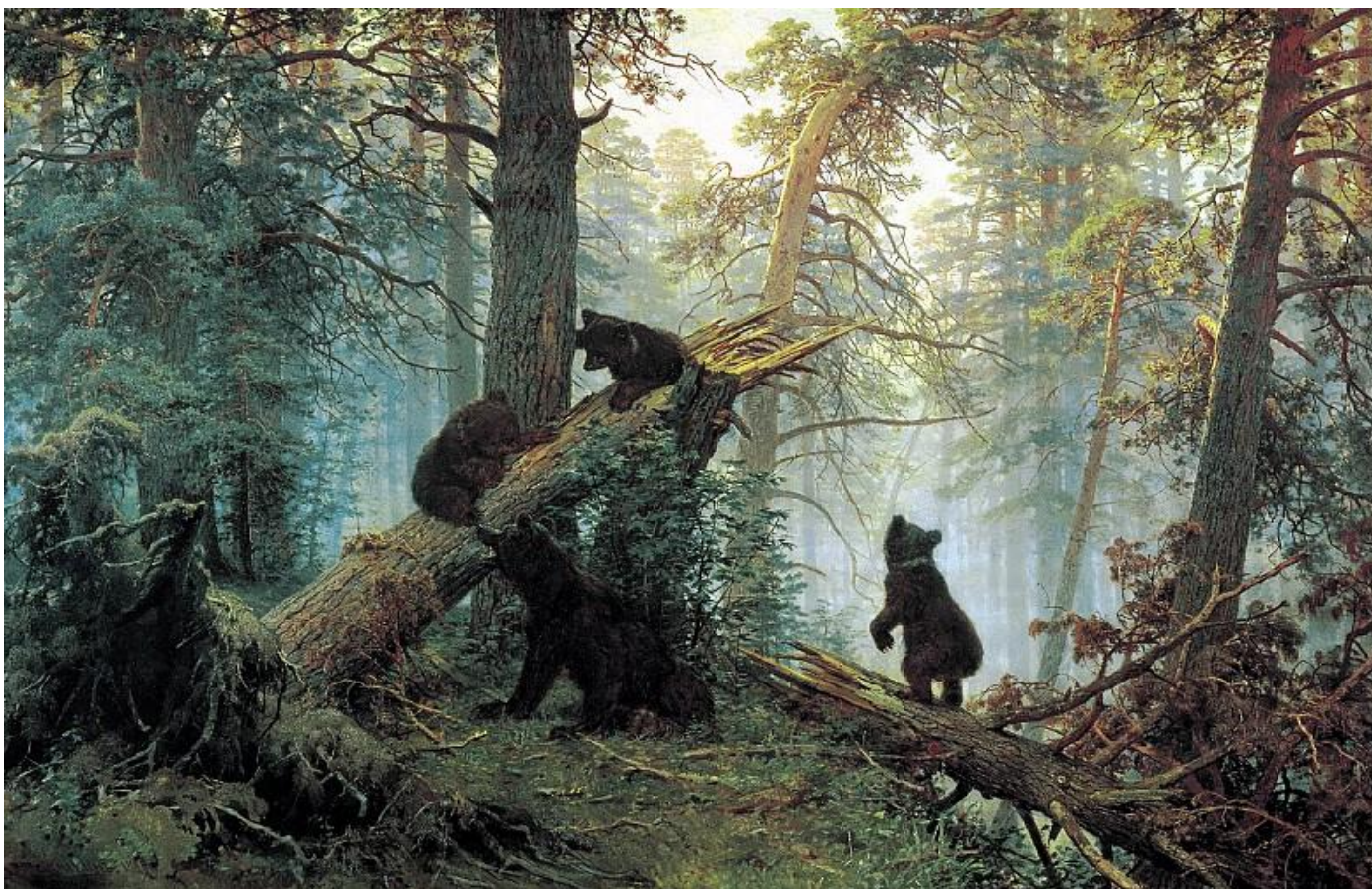
Иван Иванович Шишкин – Утро в сосновом лесу