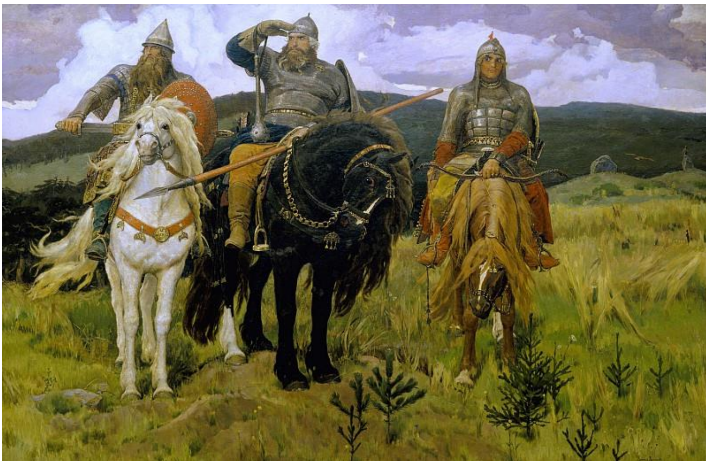
Виктор Васнецов – Три богатыря