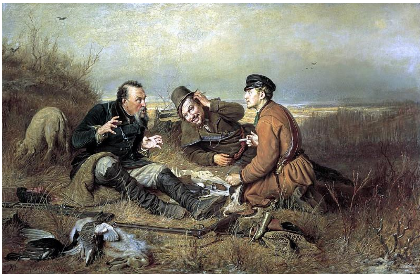
Василий Григорьевич Перов – Охотники на привале