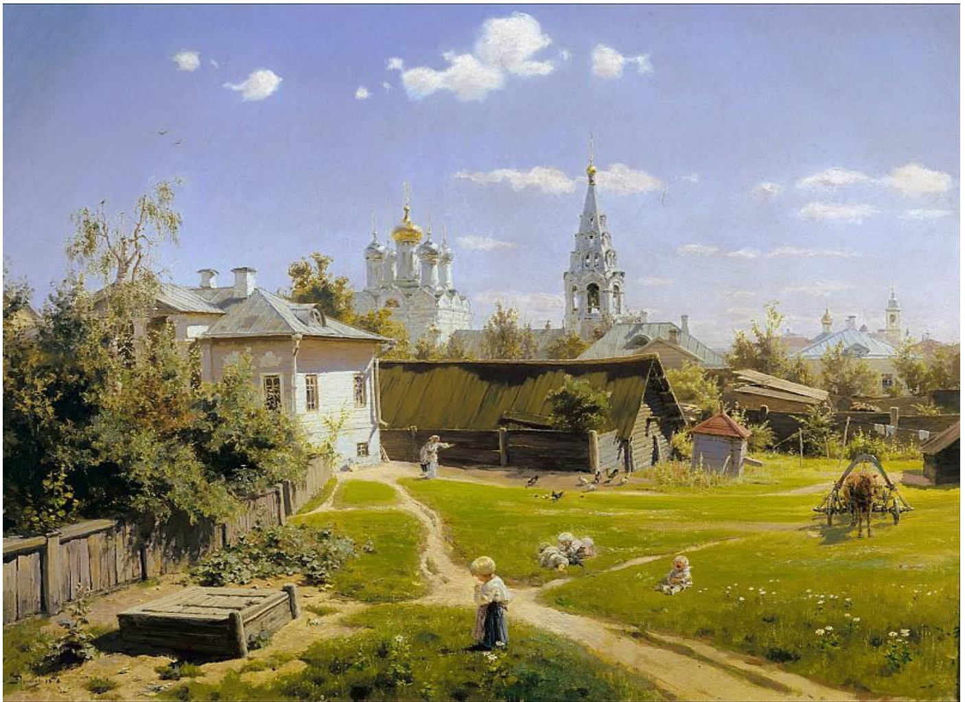
Василий Дмитриевич Поленов – Московский дворик

Русский музей – крупнейший в мире музей русского искусства, уникальный архитектурно-художественный комплекс в историческом центре Санкт-Петербурга.