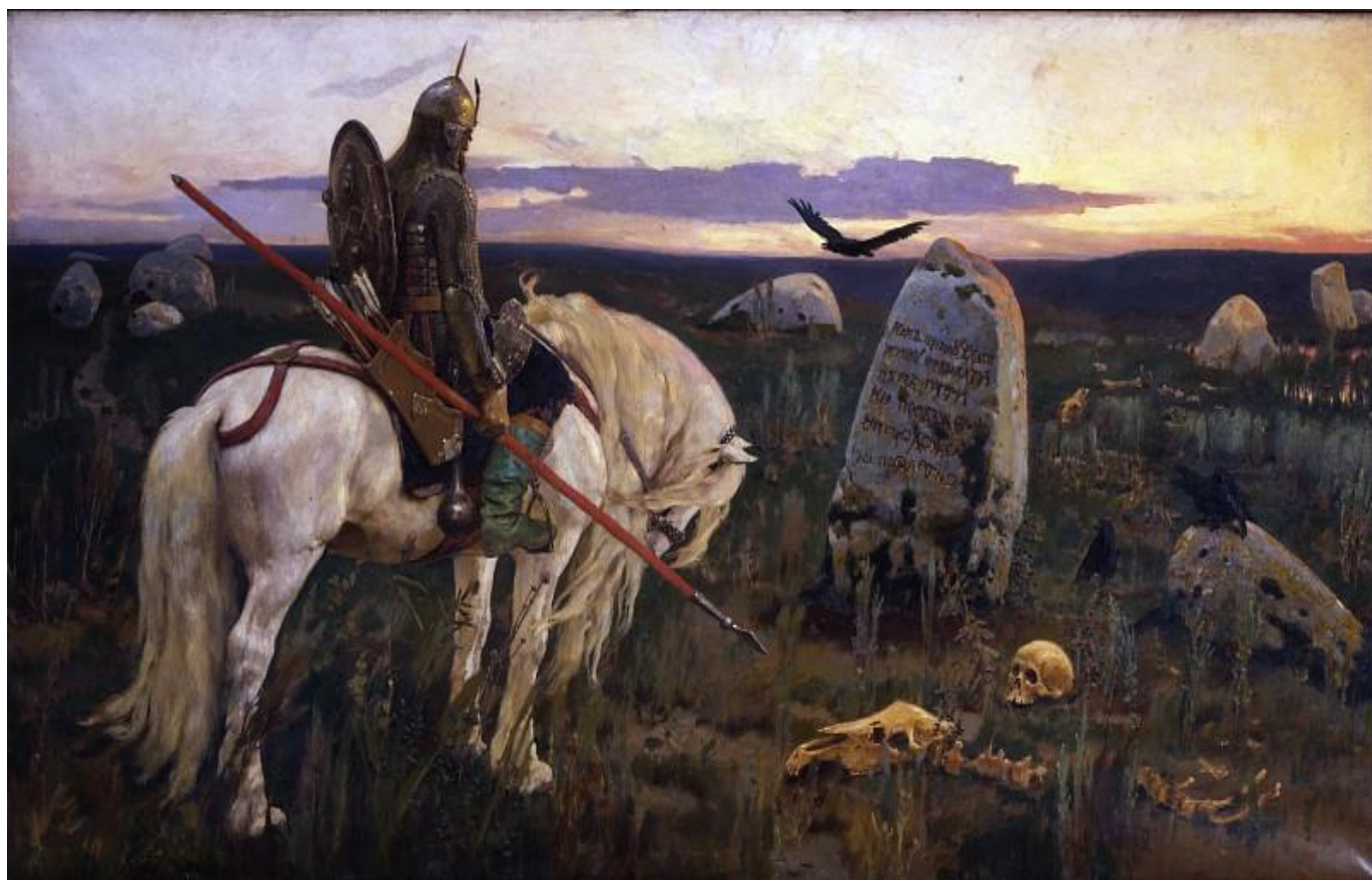
Виктор Васнецов – Витязь на распутье