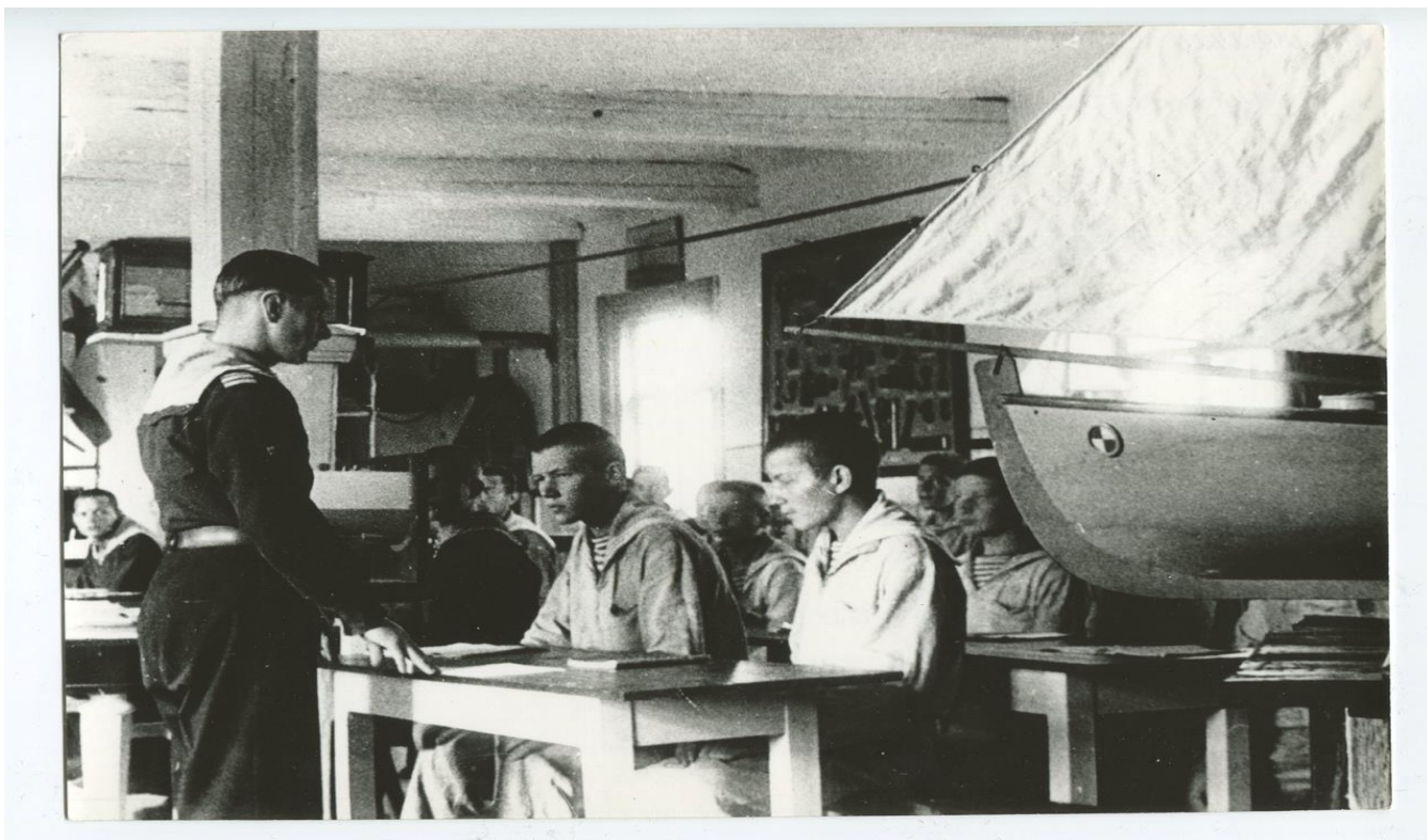
1941-44 - Курсанты Соловецкой школы юнг на занятиях по кораблевождению.

Рулевые занимались прокладкой курса корабля, учились читать морские карты.