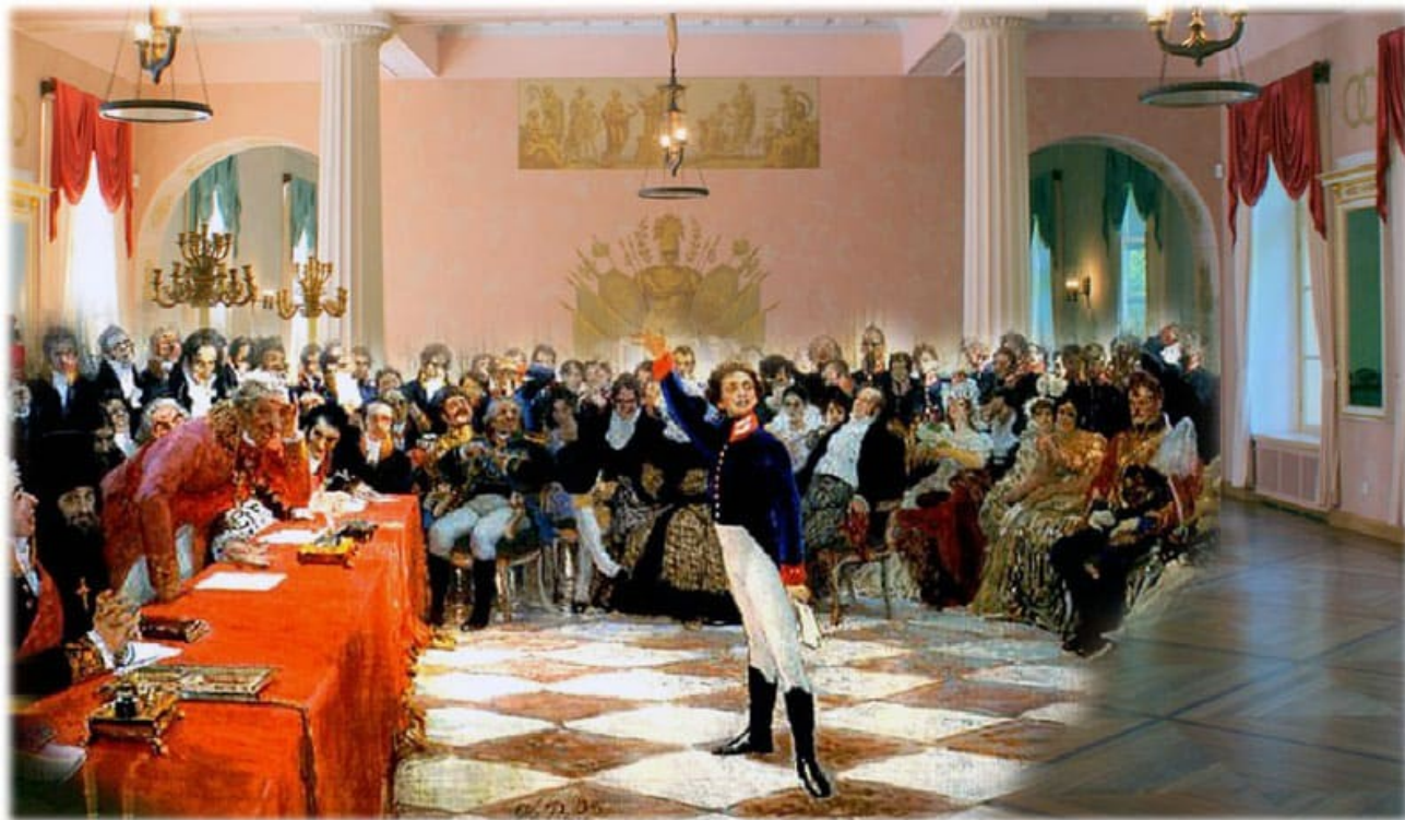
«Пушкин на лицейском экзамене». Художник И.Е. Репин.

Что это за феномен такой - как получилось, что Лицей дал так много талантливых и выдающихся людей, которые любили Россию и служили для ее блага?